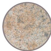
nativo Muschel-Kalk nuanciert