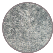
nativo Grau- Schwarz nuanciert