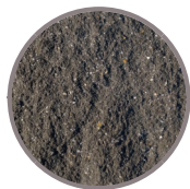
bruchrau DTE100 Schiefer