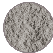
bruchrau DTE100 Grau