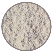
bruchrau DTE100 Kreide