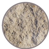
antikplus Kalkstein mittel