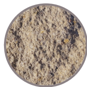
antikplus Kalkstein dunkel