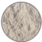
antikplus Kalkstein hell