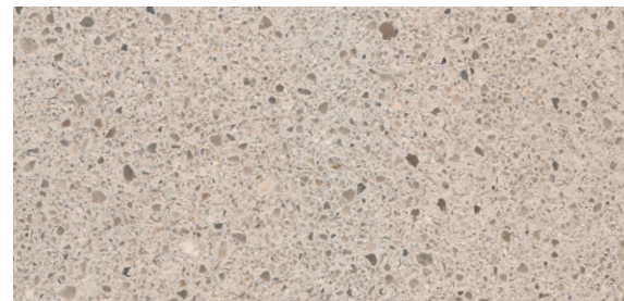
Quadratische Großformate im Weiß-Grau-Kontrast prägen das Oberflächenkonzept. Square large formats in white-grey contrast characterise the surface concept.

Wie eine Klimaanlage: Üppige Grünflächen sind ein integraler Bestandteil des Campus. Like an air conditioner: Lush green spaces are an integral part of the campus.