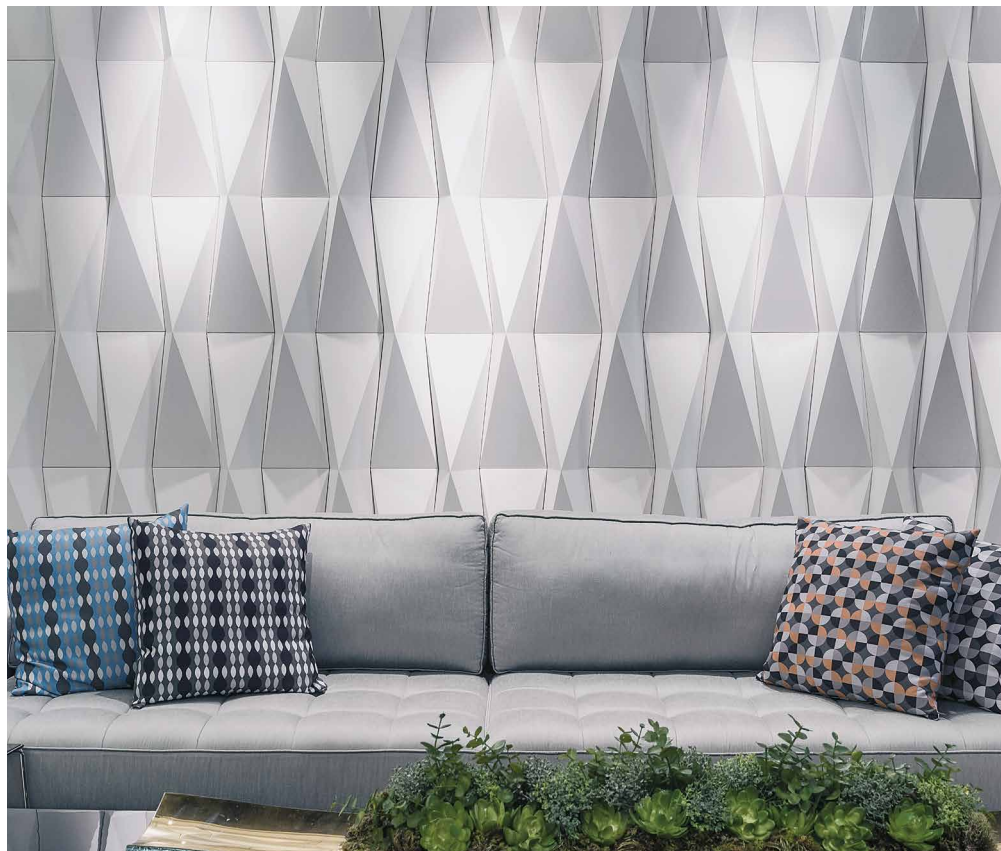
ORIGAMI visia Weiß