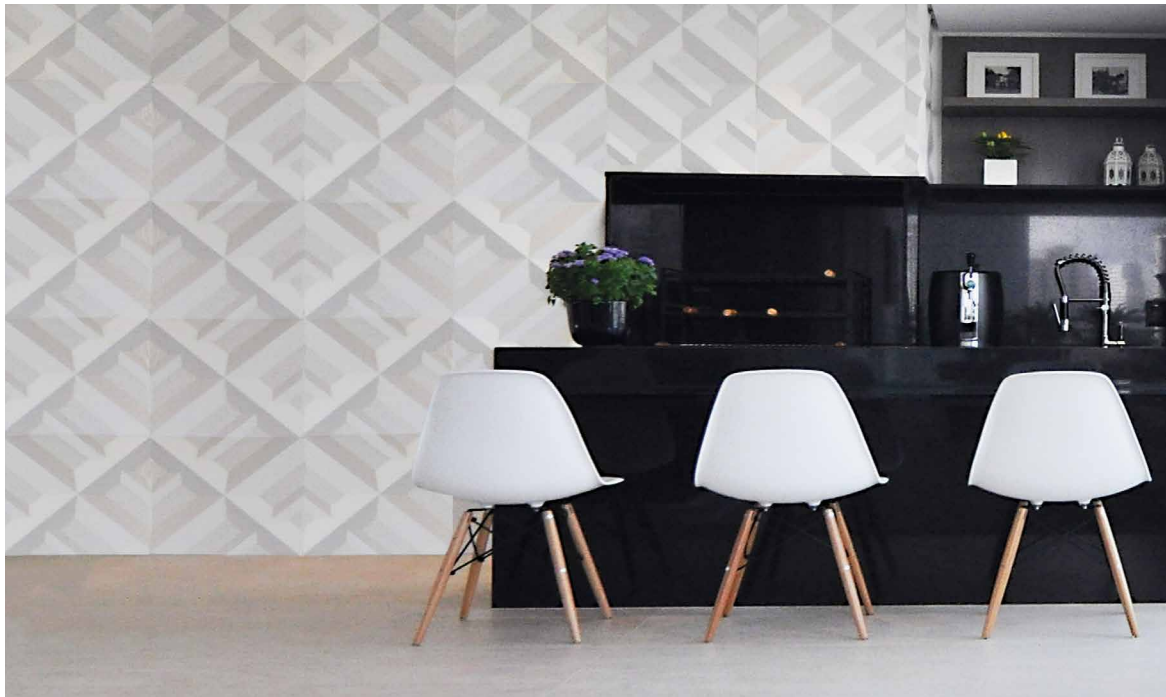
MATRICE visia Weiß