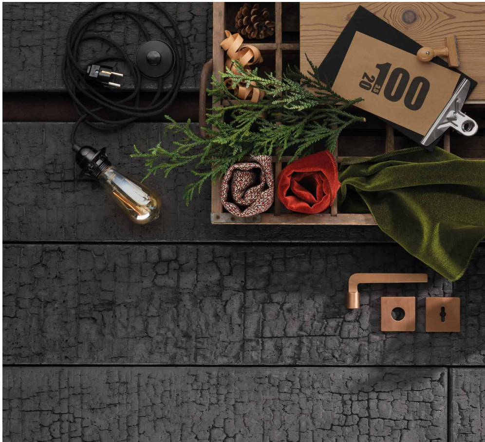
SHOU SUGI BAN visia Anthrazit